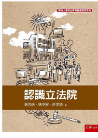
《認識立法院》 作者：黃秀端(公督盟理事長) 簡介：內容包含法案與預算的審議以及政黨間攻防及選區經營的內幕。 (有意購書，請至各大書局詢問)