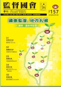
《監督國會》季刊第157期 全國唯一國會監督專刊 來電免費索取 02-2367-1571