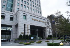
【今日新聞】民進黨力挺NCC委員同意權投票案過關 (詳見全文)