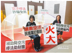
【中國時報】《空汙法》霸王條款今決戰 (詳見全文)