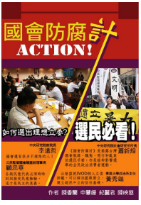
《國會防腐計ACTION!》 讓台灣國會脫線、醜態、惡行和亂象，不再重蹈覆轍，義賣價300元