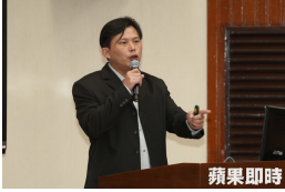
【蘋果日報】秦麗飭貪汙獲緩刑不用關 黃國昌怒：庸貪打假球嗎？ (詳見全文)