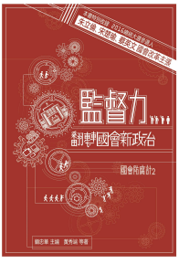
《監督力：翻轉國會新政治》(國會防腐計2) 特別收錄蔡英文國會改革主張，義賣價300元